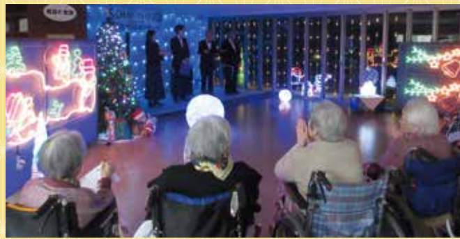
素敵な歌声と幻想的なイルミネーションにうっとり★