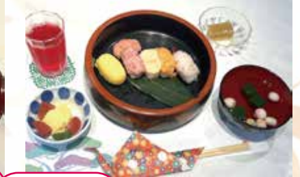
紅白麩の すまし汁