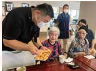
おかわりもいかがですか♪