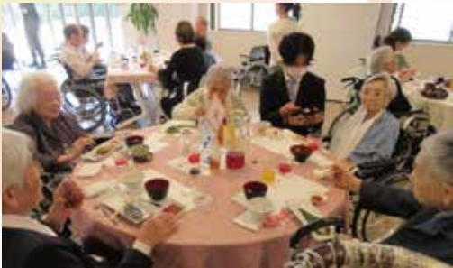
今年はお好みのお寿司を選んで いただく「特別な1貫」も!