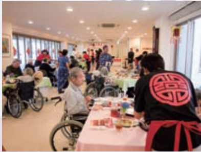
中華飯店をイメージしたレイアウト