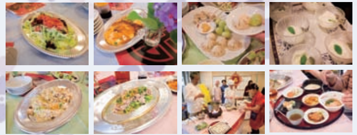
チャーハン・蒸し鶏のサラダ・かに玉・ラーメンなどなど 鉄板メニューがずらり！