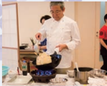
理事長お手製の本格チャーハン！