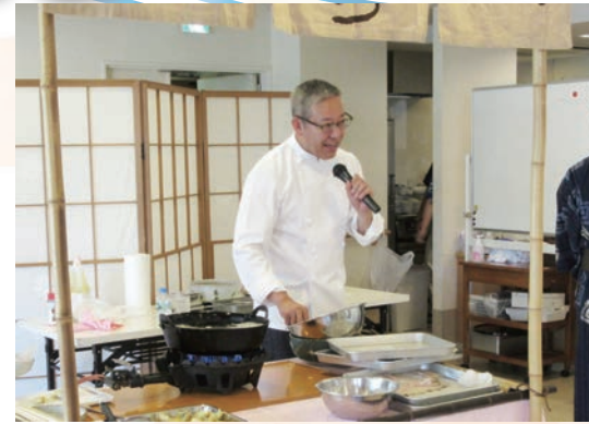
天ぷら“さほら”も開店