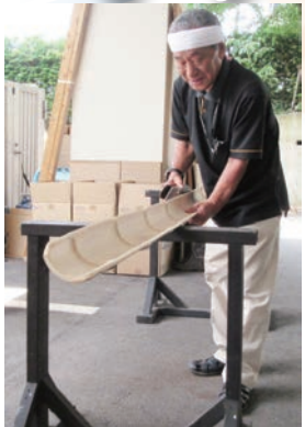
青竹をくりぬいて角度を調節して