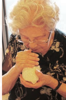
お香の雅びな香りを心ゆくまで聞いている利用者の方々