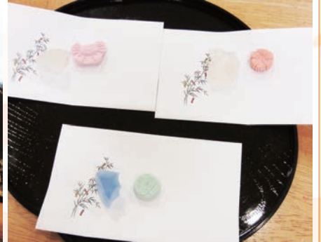
お茶菓子も夏模様……