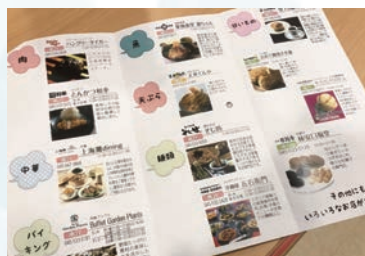
何を食べようかしら? 迷う楽しみ……