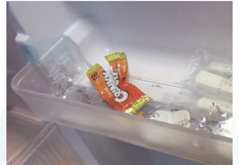
食べかけのチョコが剥き出して

このような事が無いように、と、毎日曜日冷蔵庫内をチェックさせていただいています。が、処分させて頂く時には、ちょっとしたバトルに……“心を鬼”にしています事をご理解下さい。ご家族の皆様にも、ご面会時にご協力いただければと思います。また、年間を通して以下のご協力をお願いいたします。