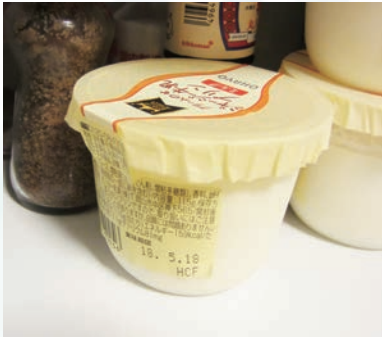
賞味期限が翌日のプリン3個

そこで、今回は、食中毒予防の観点から、ご利用者の冷蔵庫内を拝見させて頂きました。