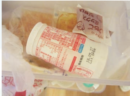
飲みかけのジュア