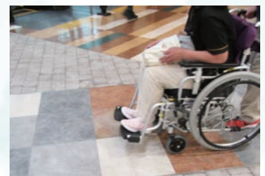
この坂の傾斜を安全に上るには……?