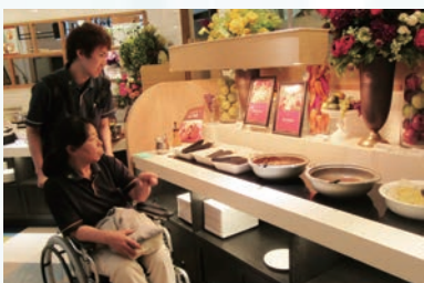
車いすでの注文をシミュレート