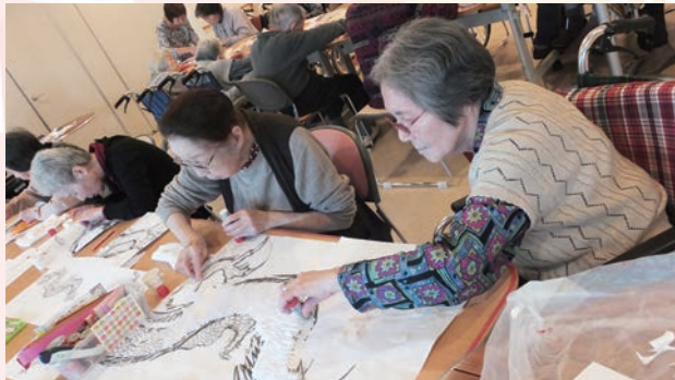
鋭意制作中……そして!