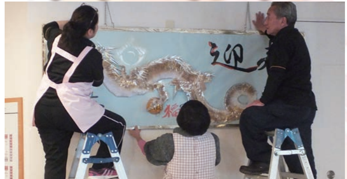
いよいよ掲揚! 謎の生物が空を舞う瞬間です。