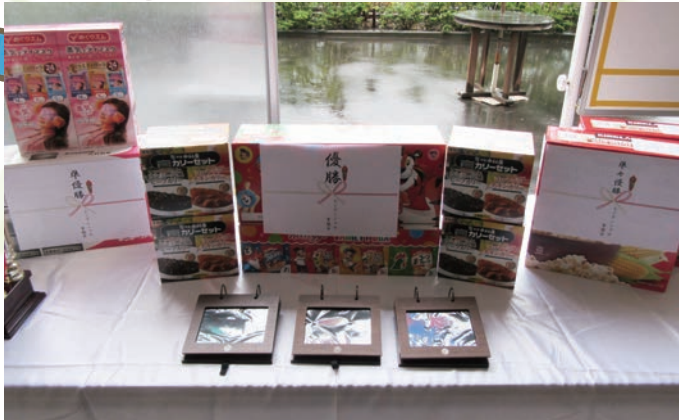
数々の賞品！ 果たして優勝トロフィーは何番街に！？