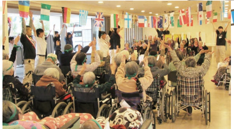
怪我をしないように……準備体操は入念に！