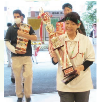
3番街が優勝！ 4番街の5連覇を阻みました！！