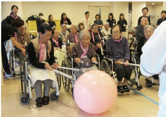
熱戦が繰り広げられます。