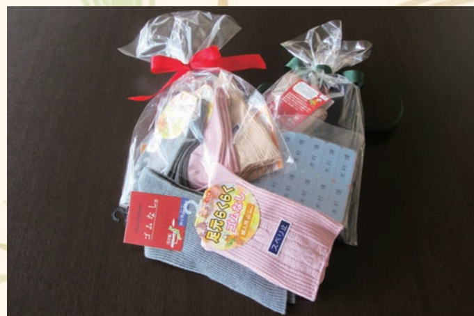
衣類迷子がなくなりますようにという願いも込めております

好評だったサマーバーゲン老舗問屋(株)宮入さんの1番の売れ筋商品という「足元らくらくゴムなし靴下」をプレゼントさせていただきました！さらにこの靴下にはご利用者さまの皆様のお名前を施しました。使用したのは“名前シール”！こちらの名前シールも各自28枚添えておりますのでご活用ください。