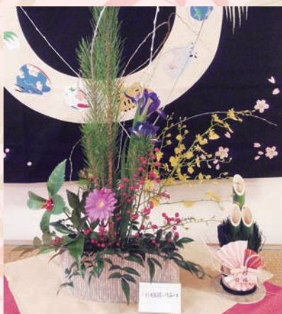
2番街の趣あるお正月飾り