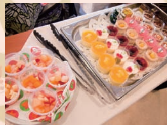
常盤台農園の野菜をふんだんに使ったツリーサラダ! ケーキも大人気でした。10個食べたご利用者さまも……