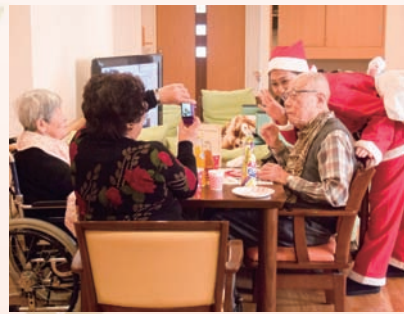
ご家族と、番街の友達と、職員と……2015年を振り返りながら