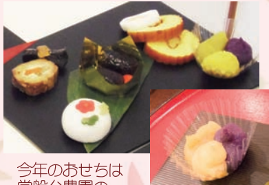
今年のおせちは 常盤台農園の 3色きんとんに注目!