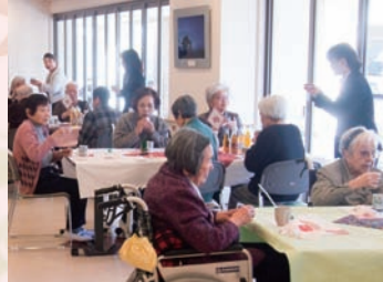
おとそで「おめでとうございます!」