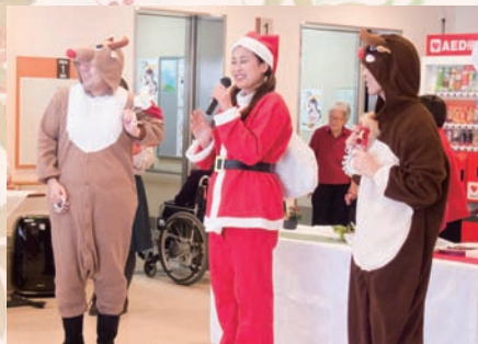
今年はなんとサンタが登場!