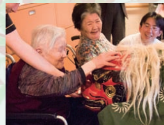
無病息災を願って…… 今年1年、たくさんの福が訪れますように!