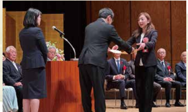
皆様の権利を守る活動を続けていきます