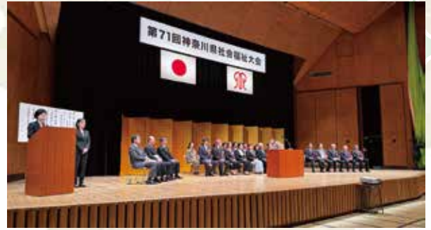
神奈川音楽堂で授賞式