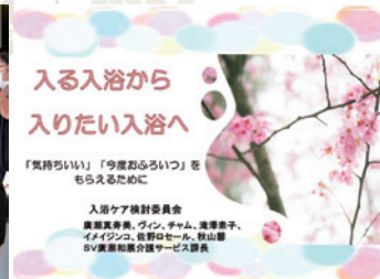
高橋施設長賞は“叙々苑でのお食事”